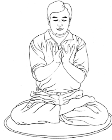
La position des mains en lotus

Fa djeun'g t'hièn coun sié eu t'huan mié