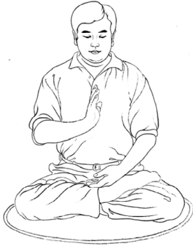
Tenir une main dressée